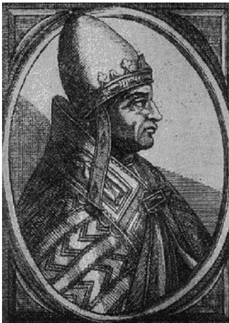
VII. Gergely (1073-1085)

Törhegyig tartó viták után lemondatták az összes regnáló pápát és újat választottak. Mintegy mellékesen tárgyalták az eretnekséggel vádolt prágai pap, Jan Husz ügyét is. Zsigmond, aki mellékállásban cseh király is volt, meg akarta menteni honfitársát. Tudta, hogy tanai nyílt fülekre találnak a cseh népnél, és ha ez a rebellis tan összekapcsolódik az emberek németgyűlöletével, országában nagy balhé lesz. Akaratát az inkvizíció ellenében nem tudta keresztülvinni, és Huszt máglyahalálra ítélték. Az nagy prédikátor halála előtt azt mondta: engem megégethettek, mint huszt (csahül husz libát jelent), de utánam jön a sebezhetelen hattyú.