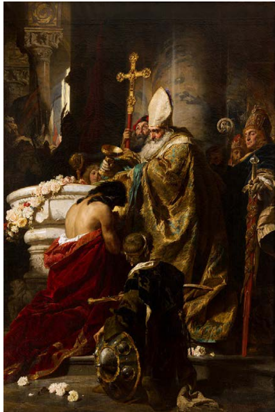
Vajk megkeresztelése Benczúr Gyula festménye Vajkot (Szent István) teenager korában keresztelték meg

számárhátra kötözve kiűzték a városból. Ilyenkor az aktuális Ottó csapataival ismét bevonult Rómába, és az új jelöltjét ültette a szent székbe. Ez István fiatalkorában legalább tízszer megtörtént.