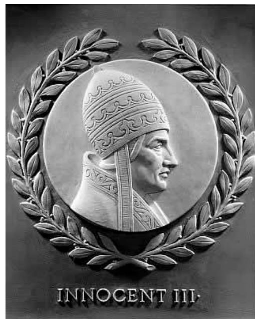
III. Ince (1198-1216)