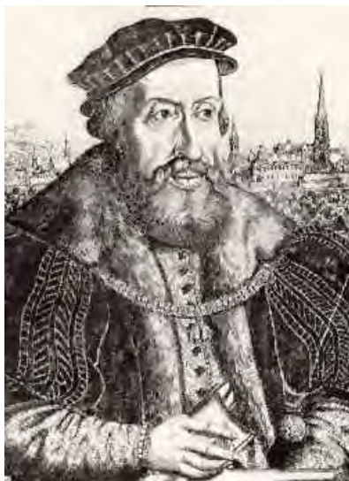
I. Ferdinánd V. Károly öccse (1503-1564)