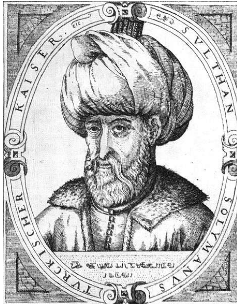
Nagy Szulejmán (1494-1566)

Magyarország így belekeveredett az európai nagypolitikába, amely a francia-német konfrontáció tengelye körül forgott, súlyosbítva a frissen kialakult katolikus-protestáns szembenállással, amely a politikának, és nem a hitnek volt alárendelve. A legkeresztényebb francia király, aktuálisan Valois I: Ferenc, aki változó sikerrel élet-halál harcot vívott V. Károly császárral. 1535-ben, egy nagy német győzelem után, szövetséget kötött mohamedán Szulejmán török császárral és koordinálták a Habsburgok elleni akcióikat. Magyarország e közé az üllő és kalapács közé került.