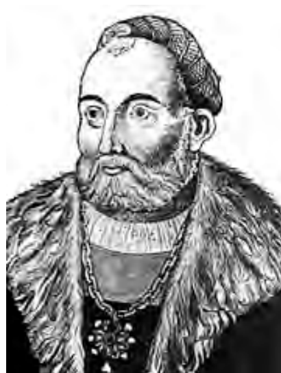
I. János E néven az első, magyarként az utolsó (1491-1542)

Az esemény 1526-ban, a mohácsi csatavesztés után három héttel történt. Miután az ifjú király is odaveszett, eléggé méltatlan, ostoba módon belefutott egy megáradt patakocskába, hír hallatára felesége udvarostól-kincsestől elfutott és őrség nélkül, üresen hagyta a várat, ahol – a krónikás szavai szerint – csak bénák és hülyék maradtak. Így a török szultán egyszerűen belovagolt a budai várba, nem mintha nem tudta volna erővel elfoglalni. A magyar királyi hadsereg színe-java már a mohácsi mező tömegsírjában várta a feltámadást. Mint később kiderült a szultán még nem szándékozott megszállni és megtartani a várat és hetek múlva el is hagyta, és málhásszekereit kincsekkel megfelelő módon megpakolva, csapatait haza vezényelte. Csak azért tett rövid, protokoll látogatást, mert a török ideológia szerint, az a föld, amit a padisah lova érintett (Allah növesse hosszúra szakállát), az örök időkre török marad.