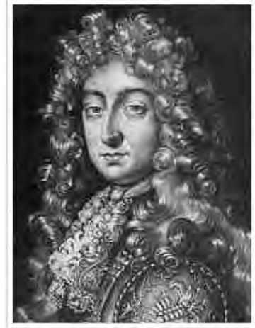
Lotharingiai Károly (1643-1690)

Az új vállalkozást, a vár, dicső múltú országuk gyönyörű fővárosuk elfoglalására irányuló intézkedéseket a magyarok ambivalensen szemlélték. Az ostromlók között azért akadtak magyarok is. Például a Rákóczi felkelésben elhíresültek közül Bottyán János, Bercsényi Miklós. Vitézségével kitűnt Petneházi Dávid, aki az elsők között hágott fel a falra. Elterjedt a „két pogány közt egy hazáért” alapvetően hamis és reakciós szlogen. A magyarok, - értsd a nemesség felső rétegét – maga mellé tudta állítani a nép egy részét. Nemrég bukott meg a rendi jogok visszaállításáért összeesküdött főurak mozgalma. Lássuk magunk előtt Zrínyit és Frangepánt a siralomházban. Tököly egyenesen török vazallus volt, és mint ilyen tevőlegesen részt vállalt a Buda védelme körüli harcokban. A császár a pápát és egész Európát képviselte, amely többségében katolikus volt és I. Lipót is a protestánsoktól akarta megtisztítani birodalmát, de nem úgy, ahogy azt híres kortársa és nagy ellenfele a Napkirály tette, aki éppen most üzte ki hazájából, Franciaországból az ott hugenottáknak hívott protestánsokat. Lipót ezt a radikális utat nem választhatta, mert a lakosság nagy többsége kálvinista volt. Az áttérést erőltette, ami sokszor sikerült is. Például Pázmány Péter is protestánsként kezdte. A kálvinisták nyomorgatásával Lipót azt érte el, hogy az országlakosok jó része még dicséretes intézkedéseit, mint Buda visszafoglalása is idegenkedve fogadta.