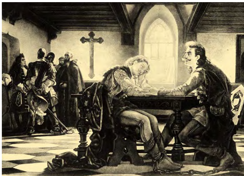
Zrínyi Péter és Frangepán Ferenc búcsúja a siralomházban Bécsújhely, 1671

Dr. Google listájában szereplő három dátumról – 1566; 1599; 1602 – sem barátom jegyzetei között, sem a Magyarok Krónikája című évkönyvszerű album sem tud semmit. Az 1566-os évben valóban volt egy nagy török hadjárat, amely során elesett Szigetvár és Szulejmán önszántából, betegségben meghalt (Allah vágja rövidre szakállát). Győrnél várakozott egy, a Szigetvár felmentésére összegyűlt hadsereg, amely tétlenül várakozott, majd feloszlott. Lehet, hogy ezek csináltak valami ramazurit Buda környékén, és ezt gondolta a doktor úr Buda ostromának.