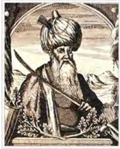
Abdurrahman budai pasa (1615-1686)