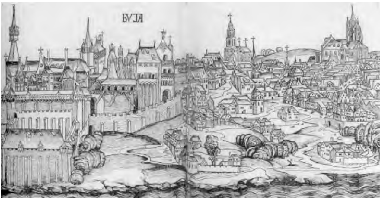
Buda látképe a középkorban

Hivatalosan Buda-Pest 1867 után lett főváros az összes szokásos, egy fővárost megillető attribútummal együtt. Nemsokára a három város egyesült Budapest Székesfőváros néven. Pár év múlva ünnepelhetjük a három város egyesülésének 150-edik évfordulóját. Ötven évig lehetett volna „székes”, de az utolsó két király közül egyik sem kívánt ideköltözni.