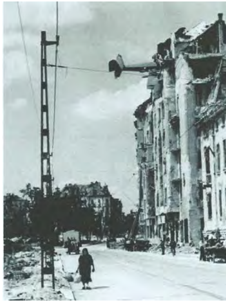
Buda ostroma – Attila út, 1945 (én láttam)

Magyarországon keresztül vonuló szárny lemaradt, a Kelet-Németországon vonuló szovjet szárny mögött. Ennyivel lett hosszabb a háború.