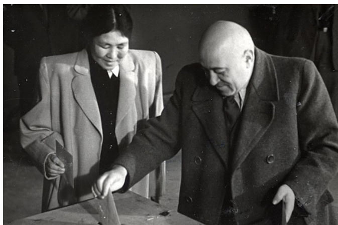
Rákosi Mátvás feleségével szavaz

szerepük. Sztálin feleségei nem voltak közismertek. Románia a maga Jelenájával ebben is különködött. Gorbacsov a saját Raisszájának szerepeltetésével tudatosan el akart térni elődei viselkedésétől.