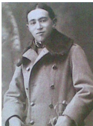
Rákosi Mátyás zászlós korában

Itthon, mint érettségizett fiatalember karpaszományos zászlósként kikerült az orosz frontra, ahol sokmillió társával együtt fogságba esett.