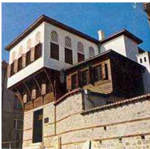
Rákóczi lakhelye Rodostóban

Nemsokára a nagy francia király napkorongja lebukott a horizont mögött: magyarul meghalt. Se kártyaklub-licenz, se apanázs. A török szultán éppen háborút készült kezdeni az elvesztett magyar területek visszaszerzéséért, és úgy gondolta, jó lesz egy Habsburg-ellenes megbízható lázadó a keze ügyében. Meghívta Rákóczit és társait Törökországba és a Márvány tenger mellett, egy Rodostó nevű kikötőben helyezte el az emigráns kolóniát. A nagy spanyol örökösödési háborút befejező békeszerződésbe, Rákóczi minden igyekezete ellenére nem foglalták bele Erdély függetlenségét és Rákóczi fejedelemségét.