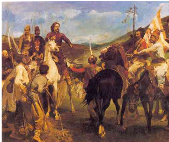
Rákóczi találkozása Esze Tamással

A szakemberek előtt ez világos, a művelt közönség nem is gondol rá. Mi közünk nekünk Canossához? Azt majd másodikban fogjuk tanulni! Vagy egy közelebbi példa. A pesti Gavroche-ok halálmegvető harca a Corvin-közben, vagy a Széna téren a világméretű, hál'istennek hidegen maradt hidegháború része. Ez nem csökkenti a dicsőségüket, de jobban bekapcsolja hazánkat a történelem folyamataiba. Általában nem is gondolunk erre, hanem egy hazafias, kebdüllesztő, világtörténelmi jellegű eseménynek tartjuk, sőt döntő szerepet tulajdonítunk ennek a csetepatének a szovjet birodalom megbuktatásában.