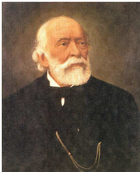
Kossuth Lajos időskori képe

márványtábla tudósít. A szerző érdekes tévedése szól a császári hadsereg bánatos szerepléséről. Jókai azt írja a Kőszívű ember fiai-ban, hogy Pál úr a negyedik kapitulációt szolgálta. Azt hittem, hogy az író gúnyosan Pál úr szolgálati idejét a vereségek számával méri. Kiderült azonban, hogy a kapituláció szó továbbszolgálat is jelentett. A néphadseregnél is volt továbbszolgálat, azok voltak ilyenek, akik beadták a TSZ-t. A legtöbben persze a BTSZ-t, adták be, ami azt jelentette: B...ok tovább szolgálni.