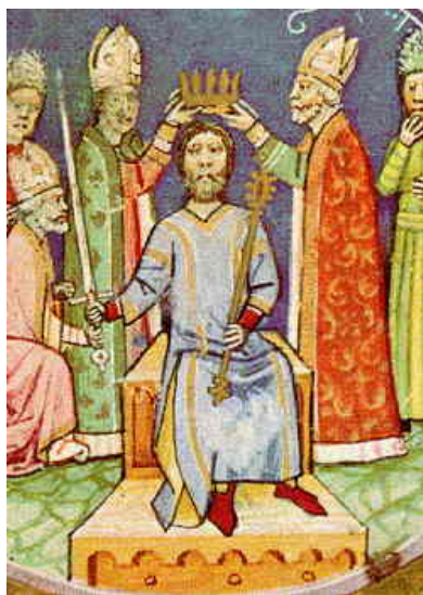
I. András megkoronázása

A legidősebb Kijevbe ment. Ott elnyerte az András nevet (eredeti pogány neve nem ismeretes), és a kijevi nagyfejedelem lánya kezét, anélkül, hogy mint a mesében, fele királyságát is elnyerte volna. Az András név arrafelé ma is divatos. Az orosz hadiflotta zászlaja az andrás-kereszt, és az építész szakma az állványozókat, akik főleg a fában gazdag szláv nyelvű Szlovákiából jöttek le, krisztároknak hívja, az állványokat merevítő andrás-kereszt miatt.