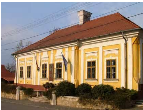
Kossuth Lajos szülőháza, Monok

Ha lenne „ki mit tud kérdés”, ki az emigrációs élet távolsági magyar rekordere, bizonyára Kossuth Lajos kapná a legtöbb szavazatot. Kossuth életének 92 évéből 46-ot töltött száműzetésben, és végig a honi politikai közélet meghatározó tényezője tudott maradni. Cinikus korunkban már elképzelhetetlen korabeli népszerűsége, annak ellenére, hogy a napi politikában, a zajos parlamenti életben csak távolról, egy-egy újságcikk, egy-egy levél formájában vett részt. Népszerűsége akkor érte el az olymposzi magasságokat, amikor már nem volt semmi hatalma, és az éljenző ütemes tapsot nem vezényelték udvaroncai.