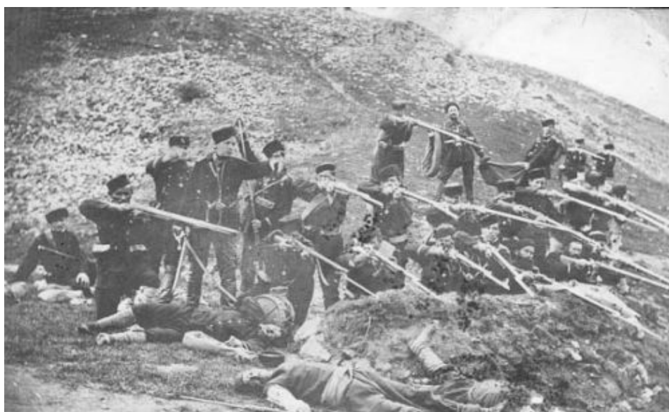
A krimi háború (1853-1856) Az első fényképes haditudósítás