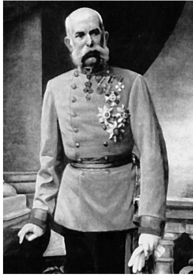
Ferenc József (1848-1916)