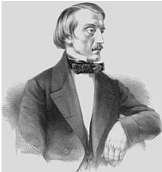
Visszarion Belinszkij (1811-1848)