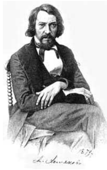
Alekszej Sztjepanovics Homjakov (1804-1860)