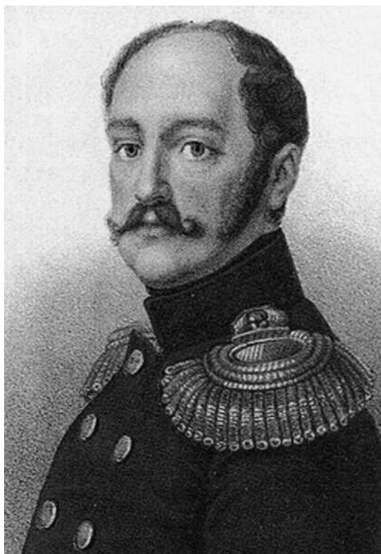
I. Miklós (1825-1855)

lengyelek miatt, akik így is szporadikusan segítették a magyar „lázadókat”, sőt Bem és Dembinszki személyében részt vettek a forradalmi honvédsereg vezetésében.