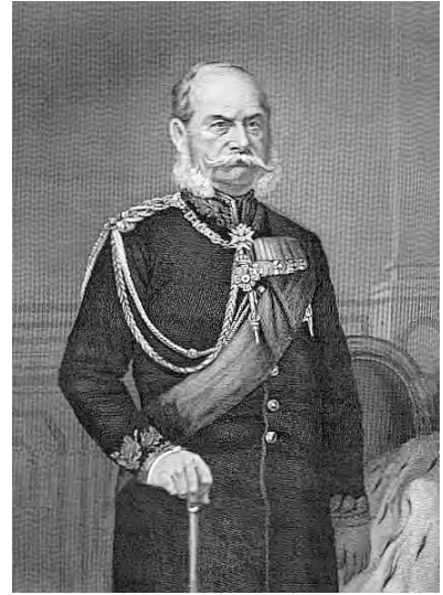
I. Vilmos (1861-1888)