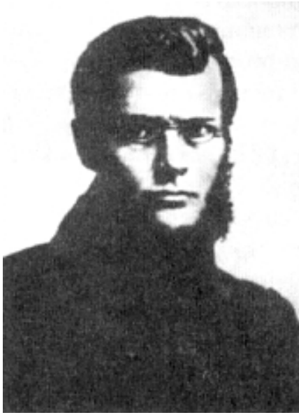
Ivan Kirejevskij (1806-1860)