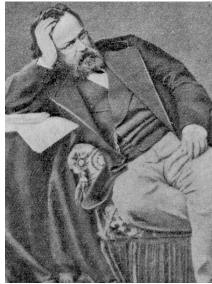
Alexander Iwanowitsch Herzen (1812-1870)