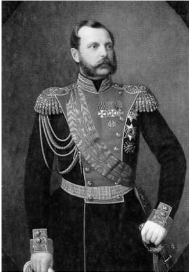
II. Sándor (1855-1881)