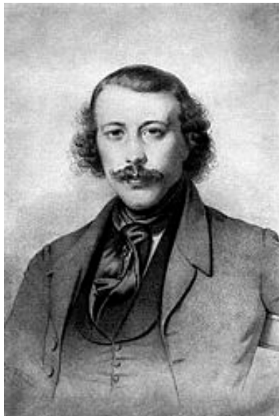
Mihail Alekszandrovics Bakunyin

Mihail Alekszandrovics Bakunyin (1814-1876), mint megrögzött anarchista, nem értett egyet a szervezett munkásmozgalommal, mert ebben a másképp gondolkozók elnyomását látta. Minden eredményre törekvő szervezet különben köteles a másképp gondolkodókat, mint téves eszméket hirdetőket, elnyomni.