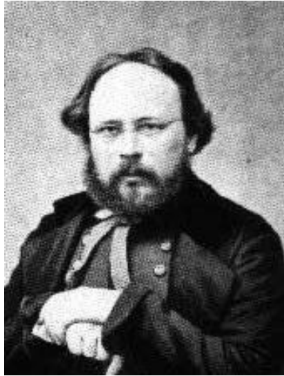
Pierre Joseph Proudhon

valahol megtermelt értéktöbblet elsajátításából származik.” (De ki tudná ezt a pontos definíciót megjegyezni, ez nem blikkfangos pír szöveg)