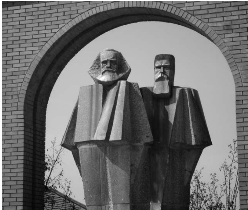
Segesdi György: Marx és Engles

Kevesen cáfolják, hogy a munkásmozgalom a XIX. század második felének és a XX. századnak legnagyobb hatású mozgalma volt, függetlenül attól, hogy céljait eléri-e? Kevesen vitatják, hogy Marx Károly a XIX. század legnagyobb hatású gondolkodója volt, függetlenül attól, hogy elméleteit már megcáfolták, és jövődölése nem valósult meg.