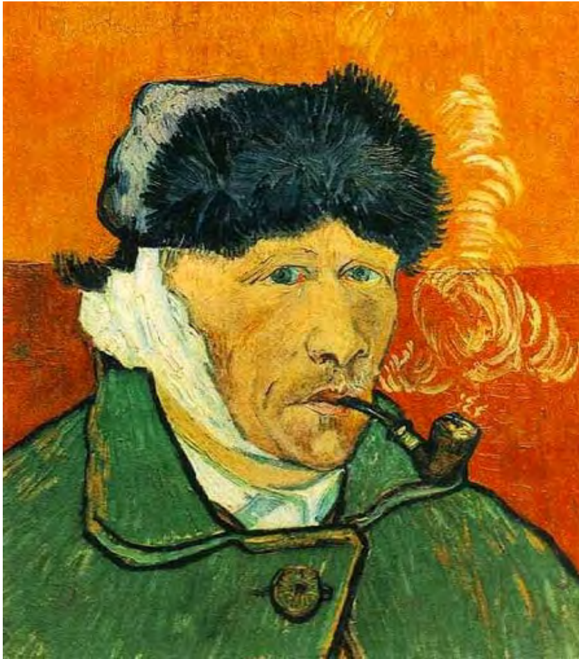
Dohányzó holland-francia festő Vincent Van Gogh (1863-1890)