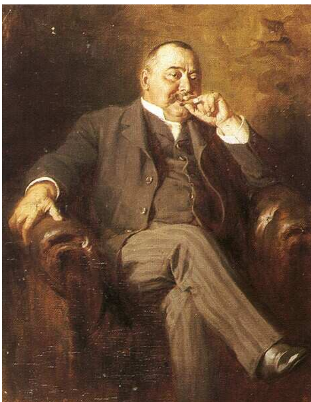
Mikszáth Kálmán (1847-1910)