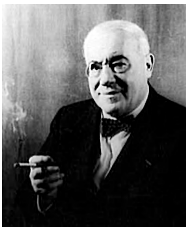
Molnár Ferenc (1878-1952)