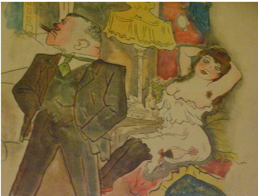
Dohányzó német buorgeois Georg Gross rajza