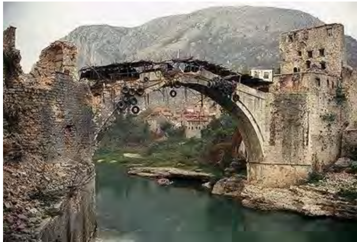
Dél-szláv háború Híd a Drinán Mostarnál

Amikor a darabjaira hullott Jugoszlávia, és népei egymásnak estek, az itthon regnáló kormány fű alatt a horvátoknak szurkolt, sőt valamelyest támogatást is küldött titokban a rendőrség könnyű fegyvereiből. Antall József miniszterelnök, a keresztény úri középosztálynak nem a legrosszabb képviselője, talán történelmi okokból – amúgy történelemtanár volt –, talán katolikus voltuk miatt pártolta a horvátokat.