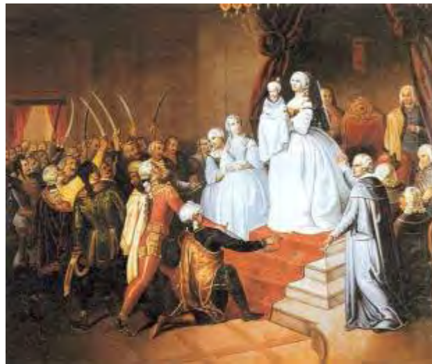
Mária Terézia a pozsonyi országgyűlésen (1740)

irányítás alá vonni. A középkori Magyarországtól elvették Erdélyt és az külön, gubernium néven lett kormányozva. Volt rendi országgyűlése, de ritkán hívták össze. A magyar területet ezen kívül megkisebítették Szlovéniával, ahol amúgy alig maradtak magyarok. Mind Horvátország, mind Magyarország területe csökkent a Katonai Határvidéknek nevezett, a hazai vármegyék hatásköre alól kivont területtel. Ezeket a majdnem lakatlan területeket még török uralom alatt maradt helyekről átszivárgó szerbekkel töltötték fel. A régi Horvátországból még hiányzott a törököknél maradt Bosznia is. A horvát szobort se működtették.