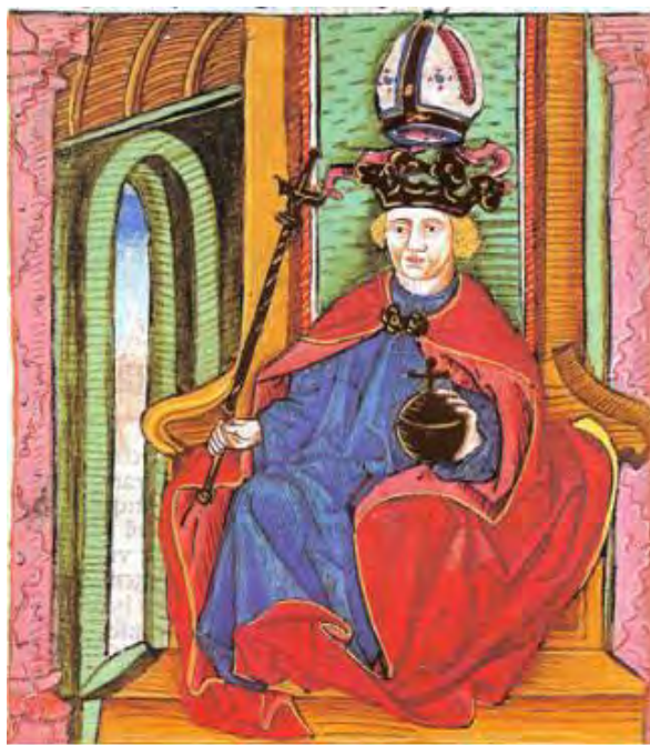
Könyves Kálmán (1074-1116)

A két király, aki déli irányban terjesztette Magyarországot hosszú évszázadokra