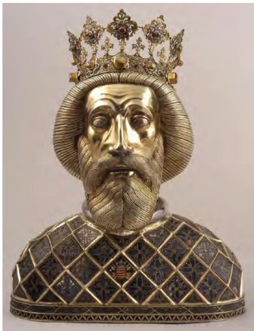
I. László (1046-1095)

A horvát királyság 945-ben alakult meg és 1095-ig, azaz 150 évig állt fenn. A bolgár birodalom bukása után Horvátország fénykorát élte. A mai horvát területeken kívül, hozzá tartozott a mai Bosznia, Macedónia, és Montenegró egy része. Mindez Tomiszláv király alatt történt. Dinasztiája Zvonimir király (1063-1089) halála után két évvel kihalt és itt lépett színtérre Magyarország képviselőjében I. (Szent) László (1046-1095).