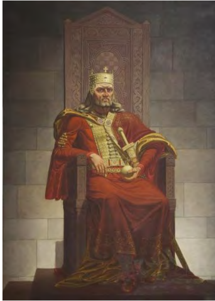
Tomiszlav horvát király Horvátország fénykorában uralkodott 910-925

Közös szülőanyánkat, Európát, túlnyomó többségben indoeurópai nyelvet beszélő népek lakják. Ezeknek a többségét három, nagyjából egyforma súlyú nyelvcsaládba osztják: román, germán, szláv. A román nyelvcsalád elnevezése nem kíván magyarázatot. Az ide tartozó tucatnyi nyelv mindegyike a latin kései, népi formájából alakult ki. Emellett az anyanyelvként kihalt valódi latin közös formája még ezer évig élt tovább. Ezt használta a katolikus egyház és a tudomány, mint közös nyelvet. Kár, hogy ez a továbbélő nyelv a reneszánsz kor a klasszikus latin tisztelői kezén a nyelvtisztító düh áldozatául esett. Annyira erőltették Ciceró és Vergilius klasszikus latinjának újraélesztését, hogy aki tehette elhagyta az immár kulináris, de funkcióját, mint az értelmiség közös nyelve remekül funkcionált, és áttért a hazai nyelvre. Ezt a nemzetközi szervezetek költségvetése bánja, a fordítók és tolmácsok siserehadának nagy öröme – akik fényesen honorált táborába alacsonyabb szinten én is tartoztam. Volt olyan javaslat, hogy az ENSZ-nek és az UNESCO-nak vissza kéne térni a latinra, de ehhez előbb a római légióknak vissza kellene menniük legalább Britanniába, de főleg Amerikába, amelynek földjét a légiósok bakancsa sohasem taposta.