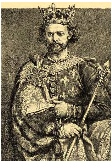
Nagy Lajos akinek országát majdnem négy tenger mosta, csak az Atlanti óceán hiányzott a gyűjteményéből (1326-1382)

A helybeli főurak megtarthatták birtokaikat, és a rendiség kialakulása után a király országgyűlést, úgynevezett „Szobort” hívott össze. A helybeliek jogállása megfelelt magyar osztályos társaik helyzetének Hamisítottak, ugyan egy dokumentumot, amely szerint a két országot perszonálunió kötne össze, de valójában egyszerű hódításról volt szó. Ide, jó messzire, Trogírba menekült a tatárok elől IV. Béla népes családjával együtt. Itt fogadta meg, hogy megmenekülése emlékére, hálaiból leányát szüzies életre kötelezi, apácának adja. Margit valóban annyira megőrizte ártatlanságát, hogy családjából negyedikként elnyerte a pápától a szent rangot.