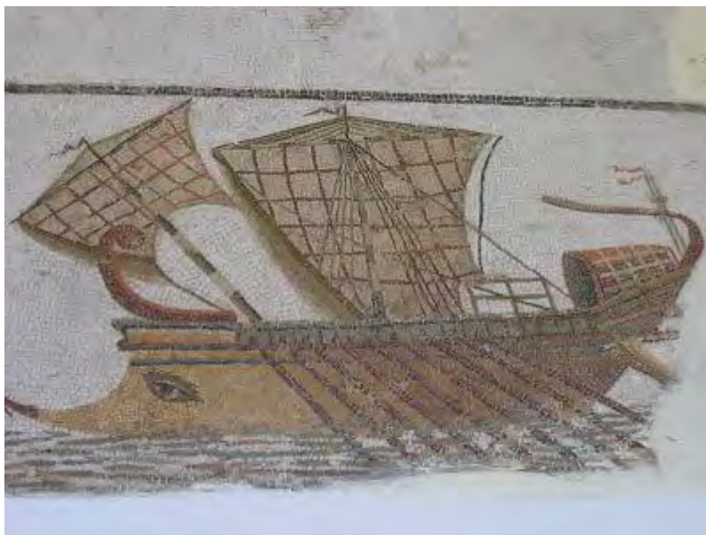
Római mozaik falikép

A másik király, Minosz, felesége, akinek a városát elpusztították vagy a Tengeri Népek, esetleg a cunami, szintén jó firma volt. A kéjsóvár bestia nem volt elégedett a férje nyújtotta szerelmi szolgáltatokkal, hanem a bikáéra vágyott. Hogy ezt elnyerje, tehénjelmezbe öltözött. A zoofilia csak a Bibliában tekintendő bűnnek. Se a görögök, se az olymposzi istenek nem voltak ellenére. Zeusz is legtöbb szerelmi sikerét állatnak öltözve érte el.