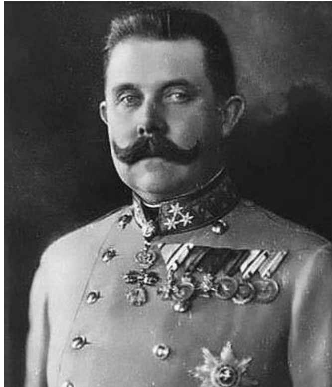
Ferenc Ferdinánd (1863-1914)

A lövések eldőrdültek, a világháború kitorrt.