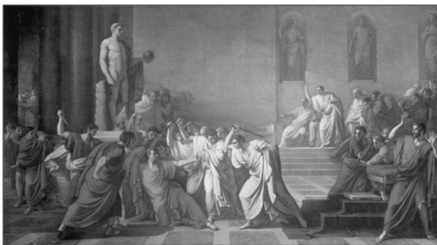
Julius Caesar meggyilkolása i.e. 44 március 15.

Petőfi Sándor, aki meggyőződéses republikánus és királygyűlölő volt. Rómában Cassius szeretett volna lenni. „Rómában Cassius valék...” stb. Cassius a Caesar ellen elkövetett merénylet egyik részvevője volt. Petőfi miért nem az összeesküvők leghíresebbjének, Brutusnak a szerepére vágyott? Mindkét zsarnokölő római arisztokrata volt, magas rangot viselt a köztársaságban. Brutus még előkelőbb volt, ősei közé számított egy régi Brutust, aki részt vett 500 évvel azelőtt az utolsó római király, Tarkvinus megdöntésében. Ez olyan, mintha egy magyar arisztokrata családját a honfoglaló vezérek egyikéig vezetné vissza. Petőfinek a szuperarisztokrata Brutus talán túl előkelő volt.