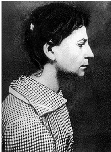
Fanni Kaplan (1890-1918)

A fent jelzett napon Vlagyimir Iljics (Uljanov) Lenin, aki akkor közel egy éve az Orosz Népbiztosok Tanácsának elnöke volt, egy gyárlátogatáson volt távozóban, amikor egy 28 éves félig vak lány, Fanni Kaplan háromszor rálőtt. Két lövés eltalálta, a harmadik csak kabátját súrolta. A merénylő anarchistaként 11 évet töltött a cár börtönében, ahonnan a februári forradalom szabadította ki. Szabadulása után az Eszer párthoz csatlakozott.