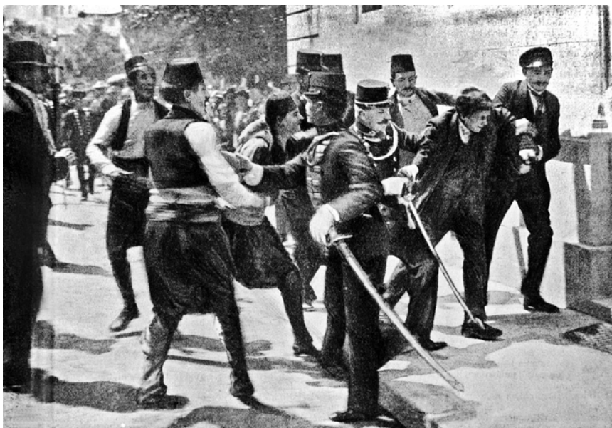
Gavrilo Princip letartóztatása