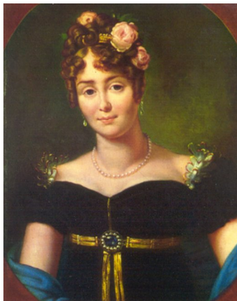
Maria Walewska 1786-1817

A következő hölgy, aki elnyerte a császár tevőleges tetszését, Walevska Mária volt, egy 18 éves szőke, kékszemű szláv szépség, amúgy férjes asszony, a 70 éves Anasztáz Walevski gróf hitvese.