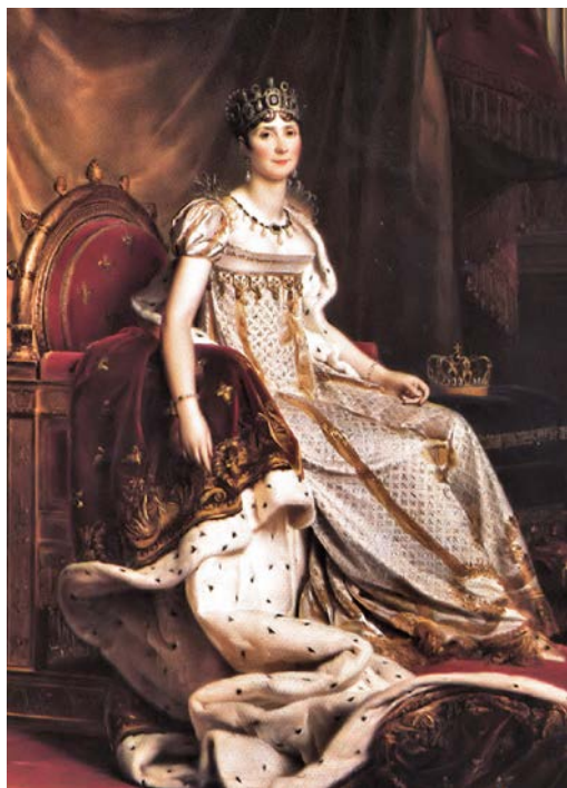
Josephine császárné 1763-1814

A siker elsőprő volt, rengeteg lázadó maradt holtan a párizsi utca kövezetén. Napoleon jó volt matematikában, állítólag fejből tudta az első negyven szám logaritmusát, de az elesetteket, kivált az ellenség elesettjeit sohasem számolta.