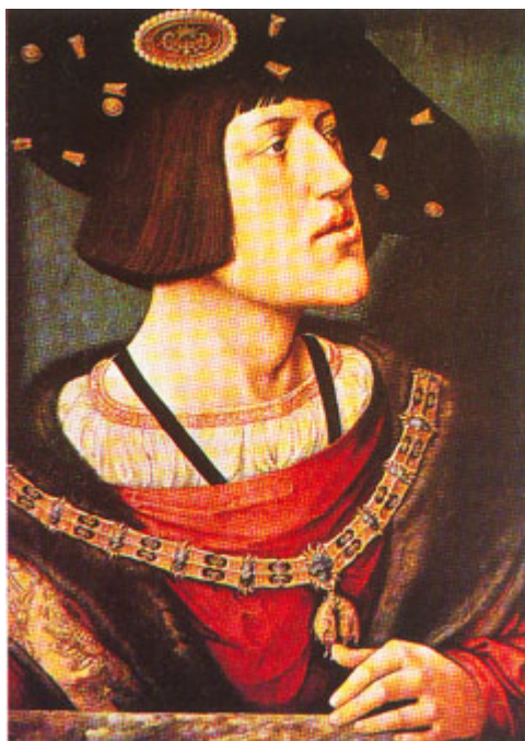
V. Károly 1500-1556