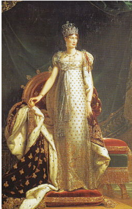
Mária Lujza 1791-1847

Közben Párizsban is folytak a házasság előkészületei. Napoleon 1809december 15. hivatalosan elvált Joséphine-től, aki egy kastélyt kapott fájdalomdíjul. (ott is halt meg 1815-ben, amikor már úgysem öltözhett volna fekete gyászpompába mint császári özvegy).