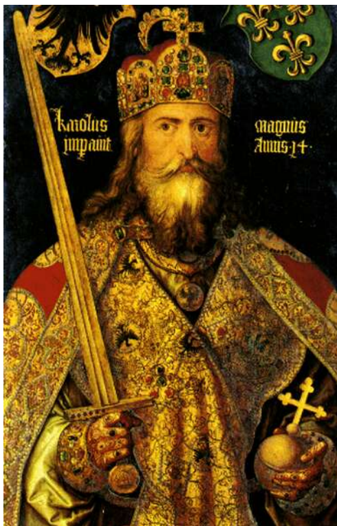
Nagy Károly 742-814

(imperátor) a még életben lévő és Bizáncban székelő rómainak nevezett birodalom imperátorának dublőrjeként.