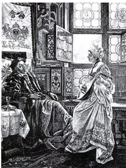
Barbara Blomberg gitározik

A lant pengetéséből született Don Juan de Ausztria, akit V. Károly elfogadott fiának és majd törvényes fia, annak féltestvére, II. Fülöp mellett nagy haditetteket hajtott végre, részint a török flotta leverésében (Lepanto), részint a németalföldi felkelők kegyetlen, de sikertelen megfékezésében.