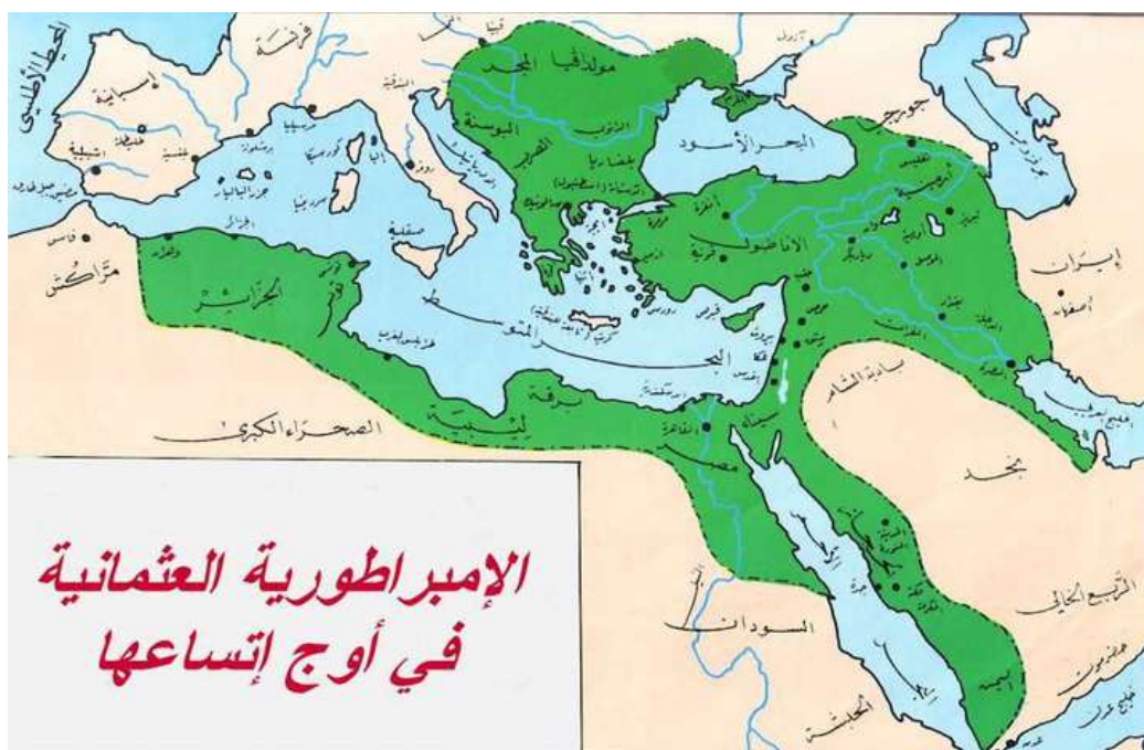
A török birodalom a XVI. században

A mai Török Köztársaság az Anatóliai, a régi görögök által Kis-Ázsiának elkeresztelt félszigetet foglalja el. Az ország területe 780 ezer km, lakóinak száma 70 millió. Ha besomfordálhatna az Európai Unióba, akkor annak legnagyobb területű országa, lakói számát tekintve Németország után a második lenne. (Közbevetőleg, az NSZK-ban jelentős számú török kisebbség él)