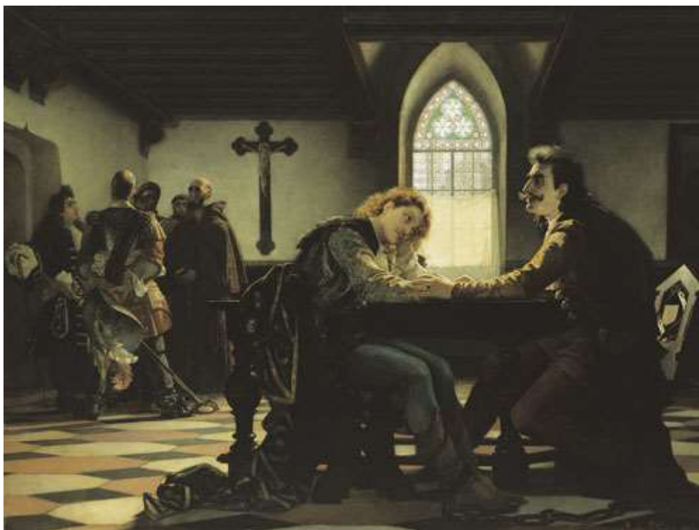
Zrínyi Péter Frangepán Ferenc a Bécsújhelyi siralomházban Madarász Viktor festménye Zrínyi Péter, Zrínyi Miklós, költő bátyja és Zrínyi Ilona apja

Amikor a császár a Montecuccoli vezette az osztrák és részben magyar hadsereg 1664-ben Szentgotthárdnál aratott győzelmét nem használta ki az ország felszabadítására, és békét kötött a Portával, a magyar arisztokrácia összeesküvést szőtt ellene. Az összeesküvés vezetője maga a nádor, a legmagasabb rangú magyar méltóság, Wesselényi volt. A császár keményen visszavágott, és két főúrt lefejeztetett. Az elégedetlenség az országban érzékelhető volt. Ezt lovagolta meg egy nem túl előkelő, de dúsgazdag ember, Thököly Imre, aki, - láss csodát, - török segítséggel a Királyi Magyarország keleti, Erdély felé eső végében, saját fejedelemséget alapított. Így, rövid időre, hazánk már négyfelé oszlott. A Porta felajánlotta neki a magyar koronát, de ő szerényen megelégedett a fejedelmi címmel, amit az osztrák császárral is sikerült elfogadtatnia.