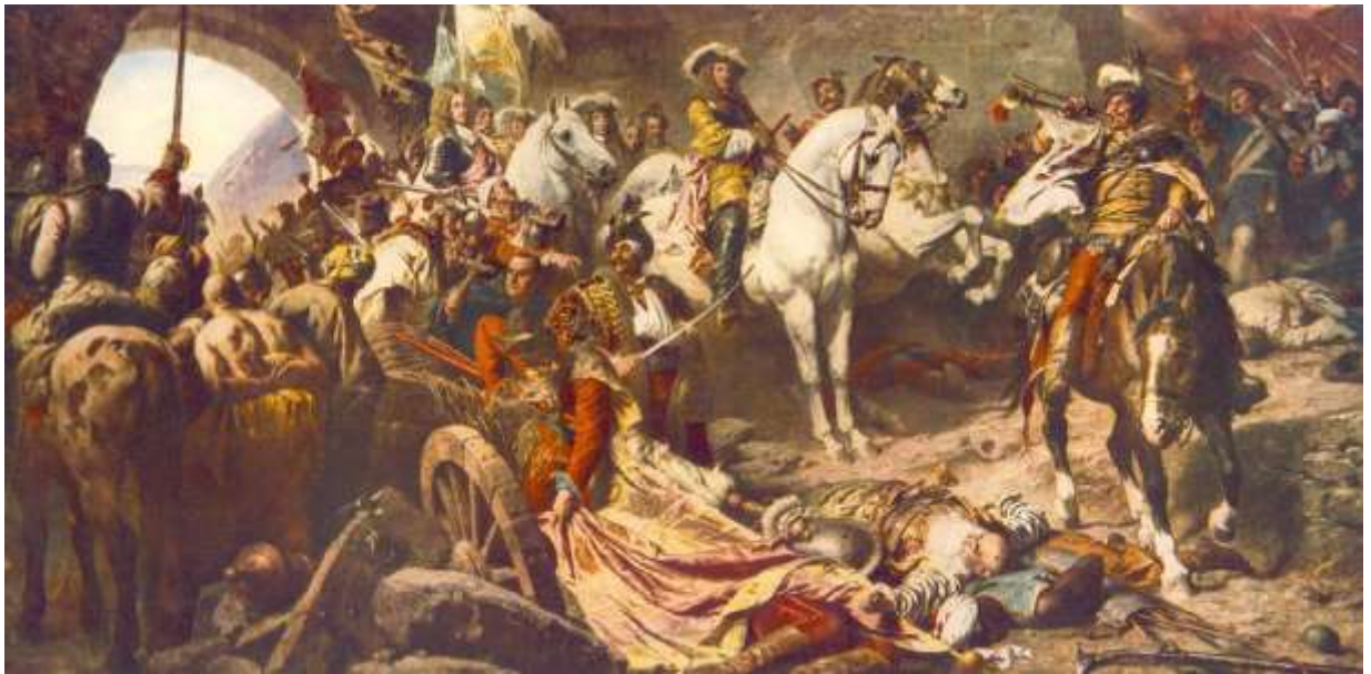
Benczúr Gyula: Budavár visszavétele (1896) Jól megkomponált maradi kép