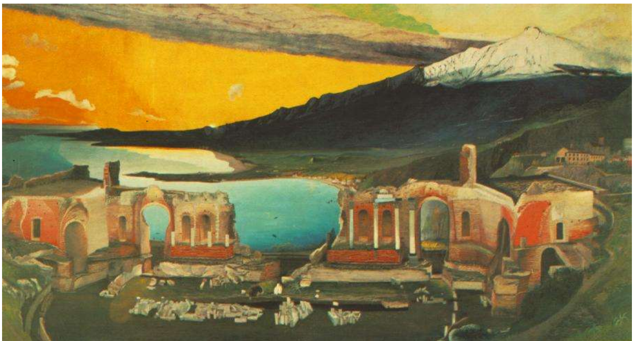
Csontváry: Taorminai görög színház romjai (1904) Az egyik legjobb magyar festő képe